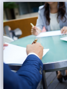
詳細は下記担当者までお問い合わせください。

様々な業種に対して教育体系の構築サポートを実施しております。構築のみならず制度(運用方法)のサポートも実施しております。