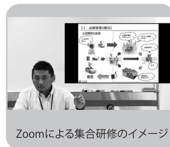
Zoomによる集合研修のイメージ

※Zoomを使用して配信します。パソコンとインターネット回線のご用意が必要となります。