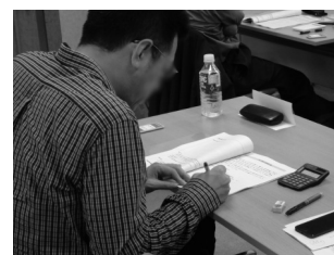
演習トレーニング風景