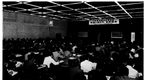
トヨタ生産方式研究セミナー会場

接なら溶接の組合が入っているとか、あるいは機械加工の組合が入っていたり、組立の組合が入っているというわけで、結局、この多能工というようなことは、アメリカの自動車会社では絶対にやれない。